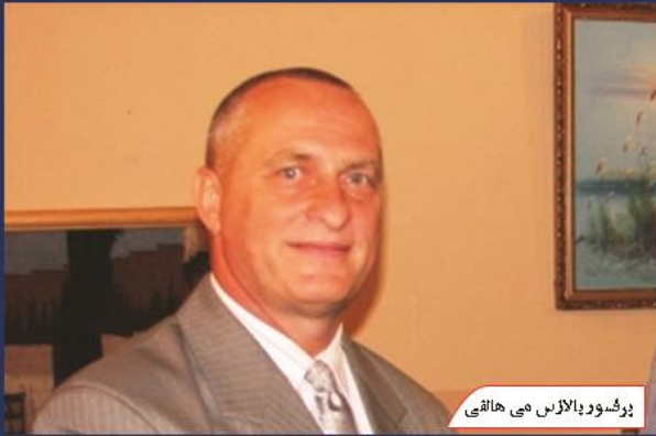
پروفیسور بالازس می ہالمائی