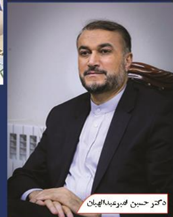
دکتر حسین امیرعبداللهیان

مجمع جهانی صلح اسلامی به دنبال نشست های علمی- تحلیلی پرسی حقوق بشر آمریکایی از سال ۸۹، ۹۰ سال نیز چهارمین همایش را به صورت مجازی با مشارکت نخبگان، کارشناسان ایرانی و جهانی، دستگاه های علمی- فرهنگی و حقوقی برگزار می کند.